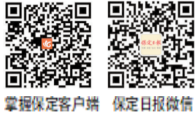
掌握保定客户端 保定日报微信