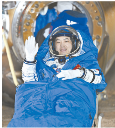
11月4日,神舟十八号航天员李广苏安全顺利出舱。