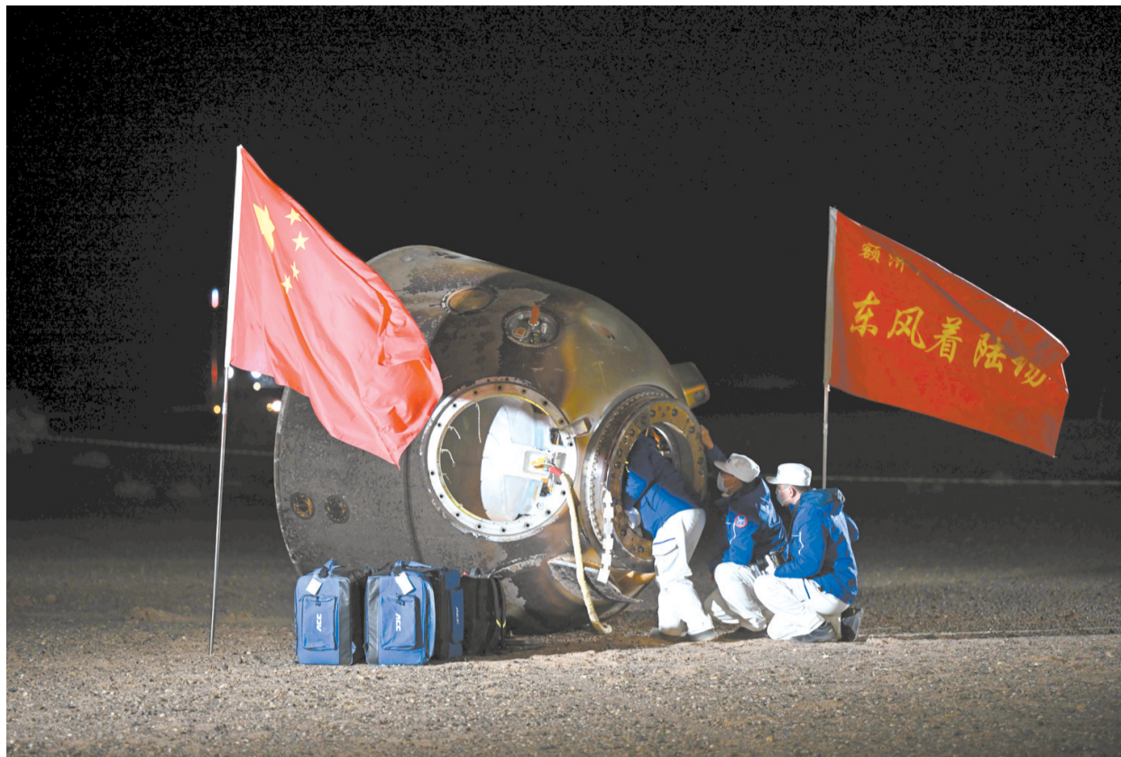
11月4日,神舟十八号载人飞船返回舱在东风着陆场着陆。

神舟十八号载人飞船于2024年4月25日从酒泉卫星发射中心发射升空,随后与天和核心舱对接形成组合体。3名航天员在轨驻留192天,期间进行了2次出舱活动,刷新了中国航天员单次出舱活动时间纪录,完成空间站空间碎片防护装置安装和多次货物出舱任务,先后开展了舱内外设备安装、调试、维护维修等各项工作,为空间站长期稳定在轨运行进一步积累了宝贵的数据和经验;同时,还在地面科研人员密切配合下,完成了涉及微重力基础物理、空间材料科学、空间生命科学、航天医学、航天技术等领域的空间科学实(试)验。