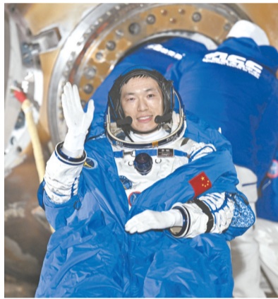
11月4日,神舟十八号航天员李聪安全顺利出舱。