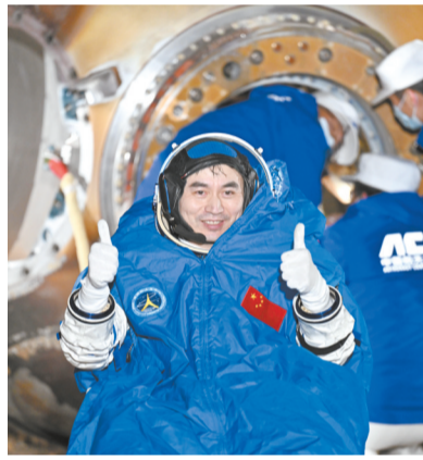
11月4日,神舟十八号航天员叶光富安全顺利出舱。