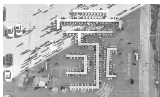
环卫工人欢聚在“家”字形餐桌前。

保定日报讯(记者安亚静 见习记者马慧杰 张怡晨)2月12日, 正值元宵佳节, 英利集团在保定电谷国际酒店南广场举办第十一届元宵家宴活动。此次活动以“环卫守护城市美, 绿电照亮新未来”为主题, 由保定市总工会、市执法局、高新区管委会指导, 高新区工会、英利集团、零碳研究院联合主办, 旨在向长期以来辛勤耕耘在城市清洁一线、守护城市颜值的环卫工人表达敬意, 确保他们“温暖过冬、温馨过节”。活动现场, 200余名环卫工人代表、志愿者欢聚一堂, 共享美味家宴。巨大的“家”字形餐桌不仅象征着团圆与和谐, 更寓意着英利集团与环卫工人及社会各界携手同心, 共创美好未来愿景。