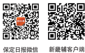
保定日报微信 新畿辅客户端