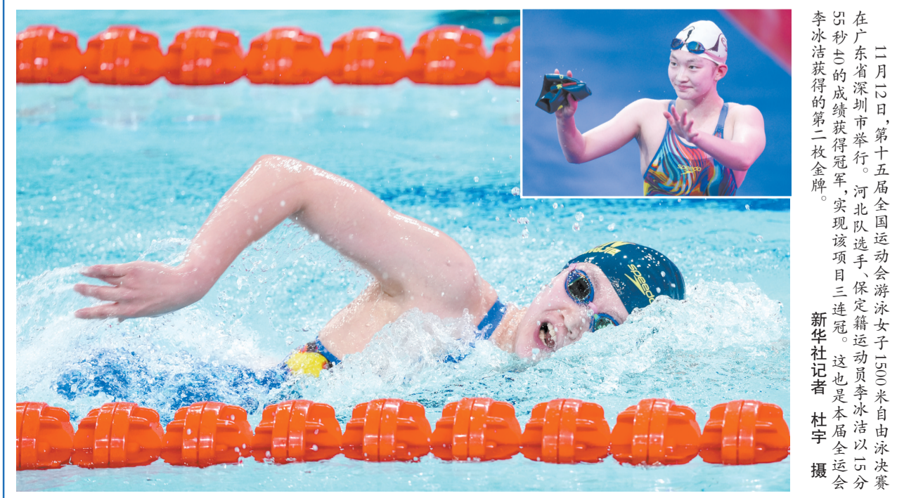
二月廿日,第十五届全国运动会游泳女子1500米自由泳决赛中,李冰洁以16分01秒05的成绩夺得冠军,实现该项目三连冠。这也是本届全运会李冰洁获得的第二枚金牌。