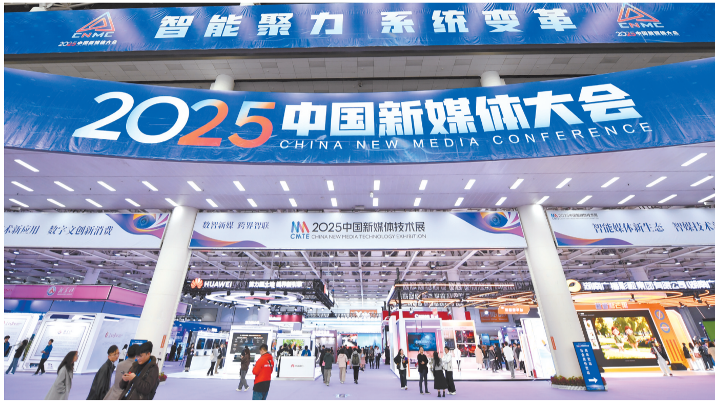
2025中国新媒体大会在湖南长沙开幕

中国以开放之姿拥抱世界,世界也以坚定步伐走向中国。“中国市场足够大、足够开放,是我们充满信心要深耕的市场”“放弃中国市场,等于放弃未来十年的增长门票”……真诚的话语,道出世界的心声和共识。今年以来,从“组团”签约到开启“倍速”模式,一批重大外资项目接连落地中国,1到9月,全国新设立外商投资企业48921家,同比增长16.2%。众多外资企业用实际行动表明,与中国同行就是与机遇同行,投资中国就是投资未来。