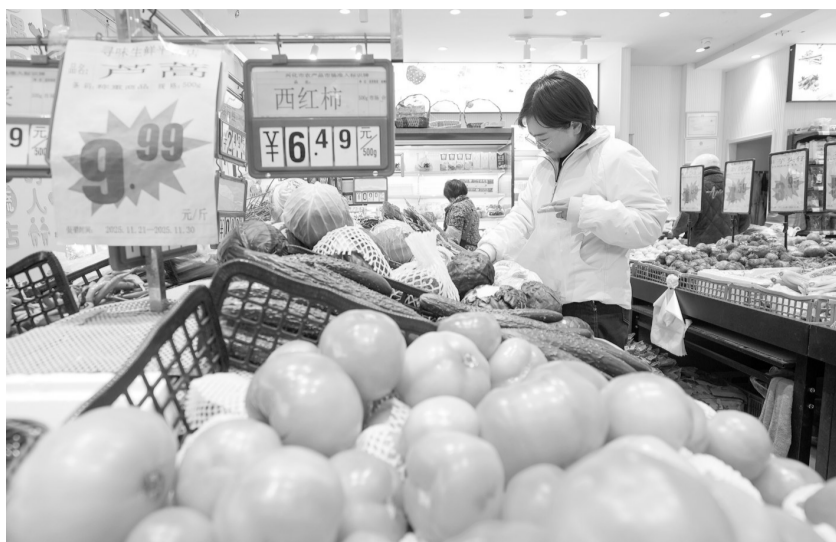
12月10日，消费者在江苏省兴化市一家超市选购蔬菜。