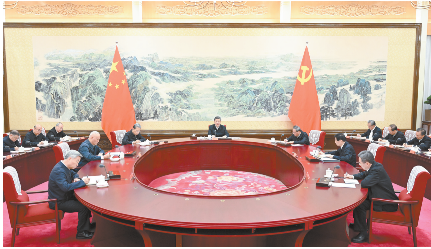
12月25日至26日,中共中央政治局召开民主生活会,中共中央总书记习近平主持会议并发表重要讲话。