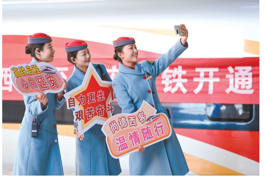
12月26日,乘务员在由西安开往延安的西延高铁首发列车前合影。

重新定义时空,高铁让中国变“小”,让梦想变“大”。伴随着飞驰的钢铁巨龙,一个更加高效流动、充满活力的中国正加速驶来。