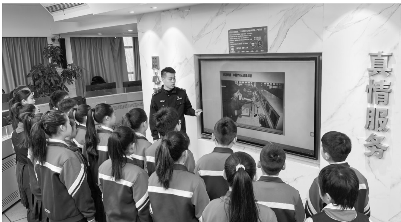
警营开放日，县学街小学师生代表走进保定市公安局110接处警大厅。