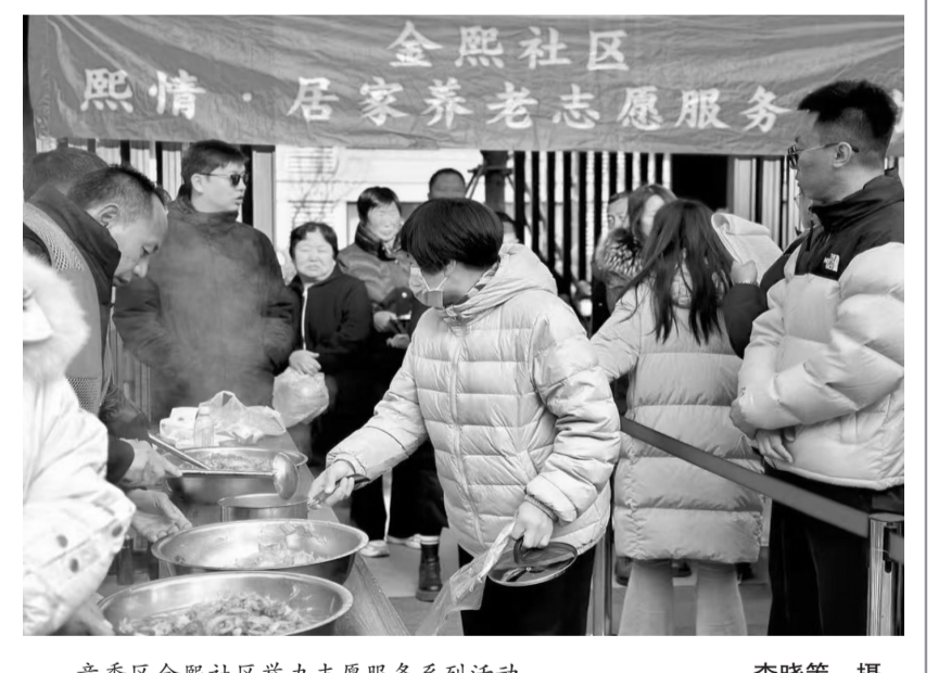
竞秀区金熙社区举办志愿服务系列活动。