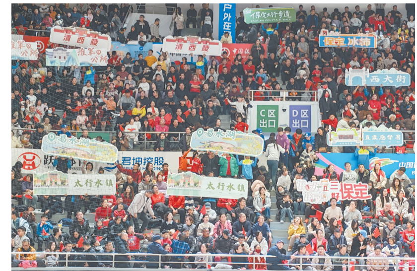
看台上观众高举保定文旅推介宣传牌。

“我们就是要坚持体育搭台、经济唱戏、文化赋能、产业带动,通过体育+文旅模式,让赛事成为展示城市形象、带动综合消费的契机。”保定市体育局副局长程艳霞表示。(下转2版)