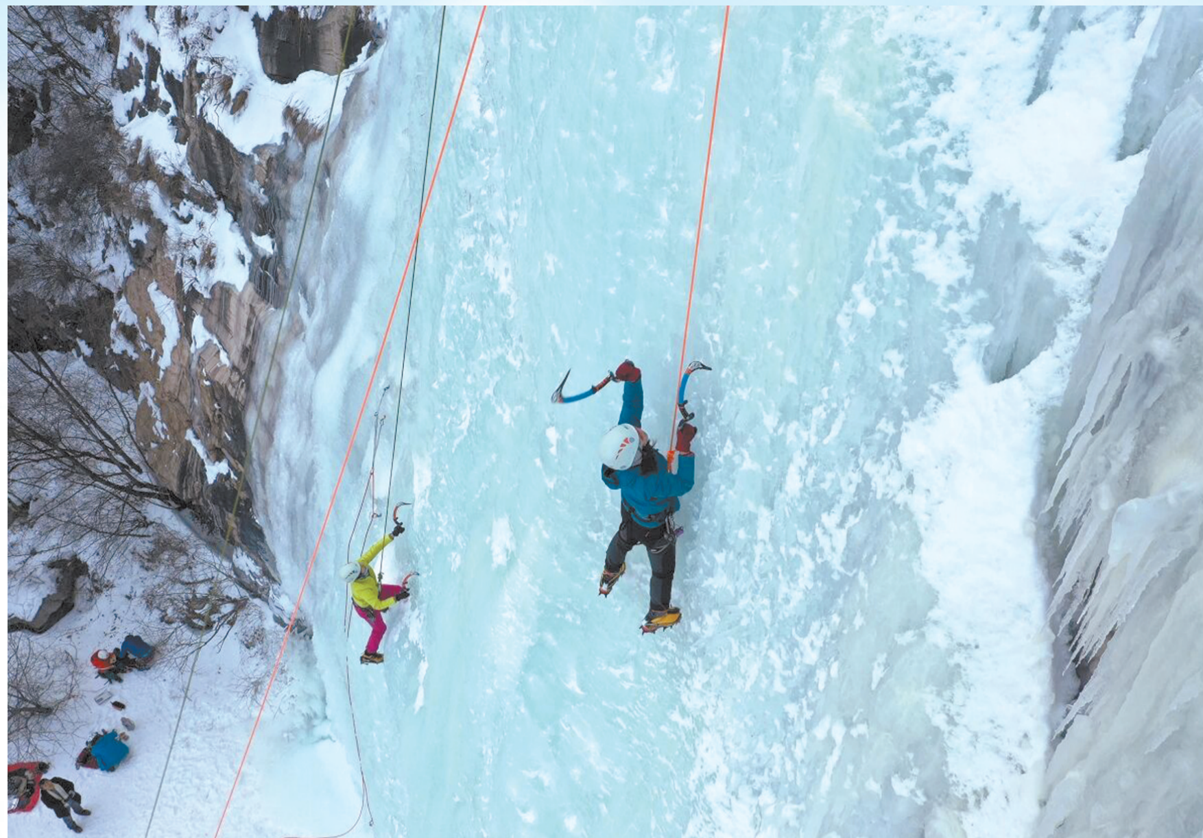
攀冰爱好者挑战阜平天生桥冰瀑。