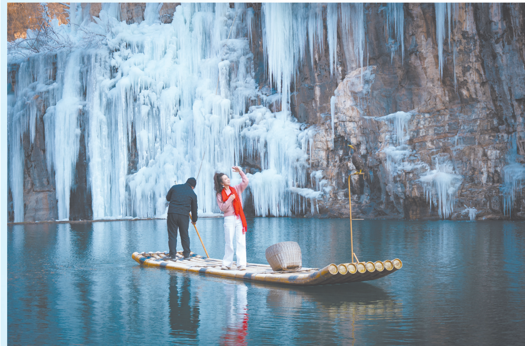
满城龙门峡谷,游客在湖面拍照。