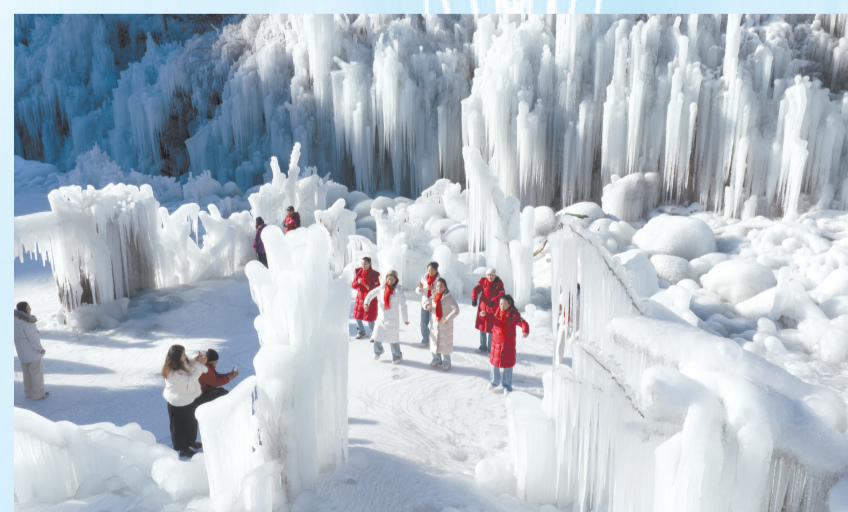
沁骨的冰爽,细腻的天工之作。