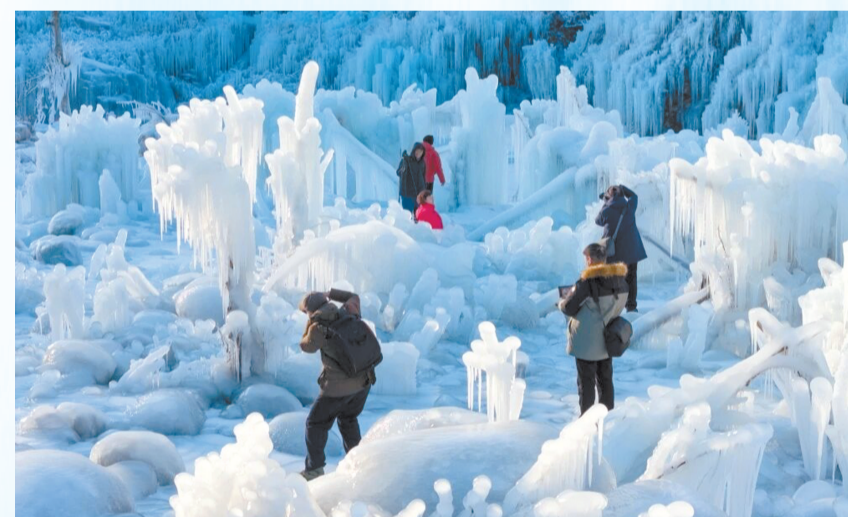
阜平夏庄,山间冰瀑,童话秘境。