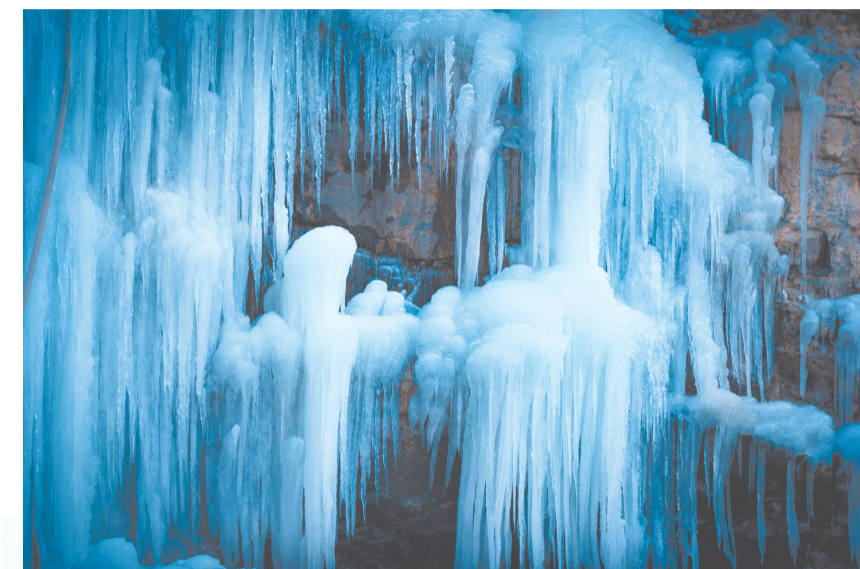
满城龙门峡谷,冰柱交错,冰笋丛生。