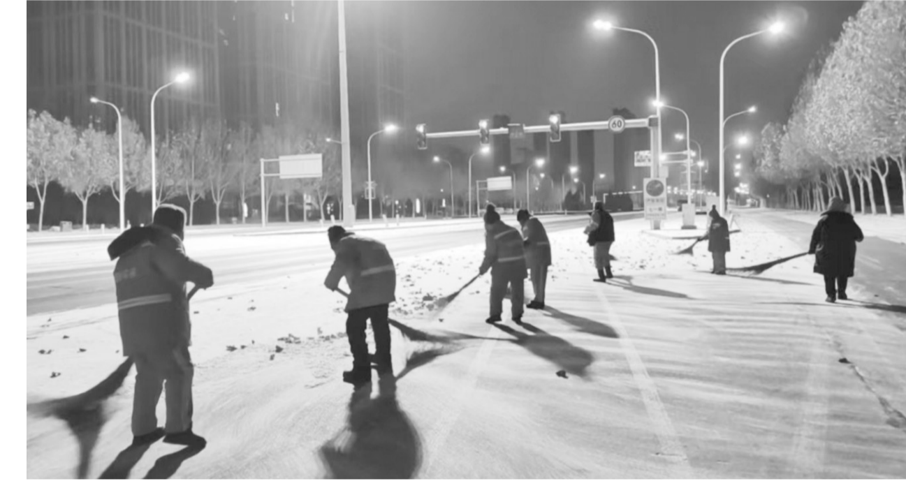
环卫“橙”物通城市路。

时间在铁锹与地面的摩擦声中、在除雪机的轰鸣中流逝。东方渐白，晨曦微露，一条条黑色沥青路面已如脉络般清晰呈现，桥梁无冰，巷弄无阻。早出的市民踏上干净、安全的路面。那些彻夜未眠的“橙色卫士”，有的仍在巡回清理残雪。