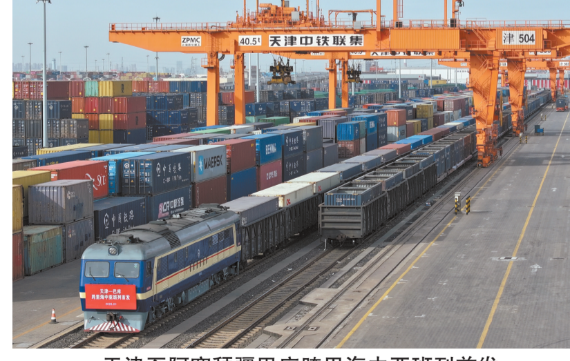
天津至阿塞拜疆巴库跨里海中亚班列首发 1月19日拍摄的天津—巴库跨里海中亚班列首发现场(无人机照片)。 1月19日,一列满载不锈钢管材、家电等货物的中亚班列从中国铁路北京局集团有限公司所属的天津集装箱中心站驶出,将经由霍尔果斯口岸出境至哈萨克斯坦阿克套港,最终经里海海运至阿塞拜疆巴库。 据了解,巴库作为阿塞拜疆首都,与哈萨克斯坦港口城市阿克套“海”相望,是跨里海国际多式联运运输通道的重要节点。该趟列车是天津开行的首趟至巴库跨里海中亚班列,为天津与阿塞拜疆、哈萨克斯坦等国家互联互通增添了稳定快捷的货运新通道。

IMF指出,全球经济面临美国引发的重大贸易干扰和不确定性,但得益于财政刺激力度高于预期、金融环境宽松、私营部门灵活应对以及政策框架改善等多重因素,仍展现出一定韧性。 报告预计,新兴市场与发展中经济体经济增长在2026年至2027年将保持在4.0%以上,发达经济体经济在2026年和2027年将分别增长1.8%和1.7%。 报告预计,全球总体通胀率将从2025年的4.1%降至2026年的3.8%,2027年进一步降至3.4%。