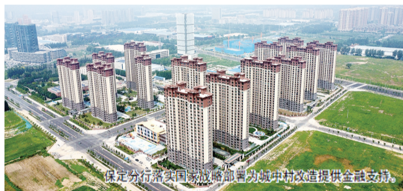
保定分行落实国家战略部署为城中村改造提供金融支持。

工行保定分行以不断建设保定现代化品质生活之城为目标，将支持城市更新与城中村改造作为履行社会责任、服务民生大局的重要抓手，充分发挥国有大行资金优势，加大信贷投放力度，为保定市城市更新工作提供了坚实的金融保障。将城中村改造视为重大民生工程，全力以赴提供金融支持。2025年末，累计投放城改项目贷款456.58亿元，贷款投放同业占比超40%，投放规模与余额均稳居同业首位，成为支持保定城中村改造的主力军。在保定城改38个项目中牵头22个项目，参贷6个项目。已累计惠及69个村庄，11.9万百姓，让更多市民实现了“安居梦”。积极为城市建设重点企业提供金融支持，累计发放流动资金贷款40亿元有效补充了企业现金流，缓解了资金压力。坚决贯彻落实“房住不炒”定位，加快落实保障性住房建设部署，降低刚需购房者融资成本，支持居民刚性和改善性住房需求。2025年末，个人住房贷款余额479.5亿元，全年累计投放住房贷款57.26亿元，极大助推了保定地区房地产市场稳健发展。