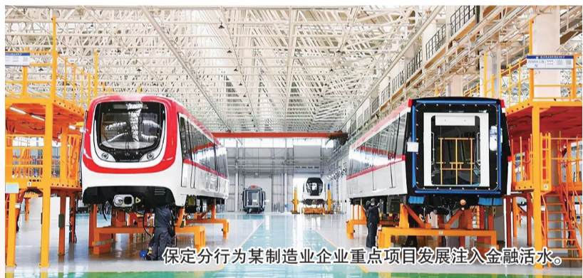
保定分行为某制造业企业重点项目发展注入金融活水。

作为服务实体经济的主力军，工行保定分行始终将制造业作为信贷支持的重点领域，围绕区域重大战略和产业升级方向精准发力，优化金融服务方案，助力保定制造业转型。2025年，全年发放重点项目贷款56.73亿元，重点支持汽车制造、输变电设备、新能源、新材料等支柱产业及重点项目发展，为区域制造业迭代升级注入强劲金融动能。提供涵盖流动资金贷款、项目贷款、承兑汇票、并购融资、国内证及福费廷等在内的全融资服务支持，累计审批金额超500亿元，贷款余额峰值超50亿元，年度票据贴现超百亿元。高度重视中小微企业服务，不断优化授信流程，提高审批效率，推出“园区e贷”“特色产业贷”等针对性产品，缓解中小企业融资难、融资贵问题，推动大中小企业融通发展。为保定制造业产业集群发展筑牢金融支撑。2025年末，个人住房贷款余额479.5亿元，全年累计投放住房贷款57.26亿元，极大助推了保定地区房地产市场稳健发展。