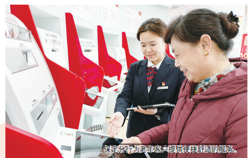
保定分行为老年客户提供便捷舒适的服务。

工行保定分行秉持“金融为民”的初心使命，聚焦医疗与养老两大民生关切领域，精准发力、主动作为，通过金融资源倾斜、服务模式创新，为市民提供全方位、高品质的医疗养老金融服务，切实守护民生幸福底线。积极参与医疗服务升级，深度融入保定市医疗信息化建设大局，累计投入超600万元用于医保移动支付平台建设，打造高效便捷的就医结算新生态。实现医保电子凭证扫码支付、自费与医保混合结算、资金实时归集等功能，大幅缩短患者结算排队时间，提升就医效率。面向辖内30家各级医院推出标准化医保移动支付解决方案，总投入超550万元，服务覆盖百万级就诊人群，以金融科技赋能医疗服务“降本增效”，助力构建“智慧医疗”服务体系。持续推进养老服务提质，全面推进适老服务网点建设，打造有温度的养老金融服务阵地。各营业网点均设置无障碍通道，依托工行驿站、小青星驿站、学雷锋志愿者工作站，为老年客户提供便捷舒适的服务环境；开设老年客户爱心窗口，解决老年人运用智能技术的“数字鸿沟”难题。依托工行驿站开展养老金融特色服务活动，结合全年金融知识普及专项行动，通过公益沙龙、专题讲座等形式，向老年群体普及养老理财、防范电信网络诈骗等知识，累计开展活动百余场，帮助老年客户提升风险防范意识与金融素养。