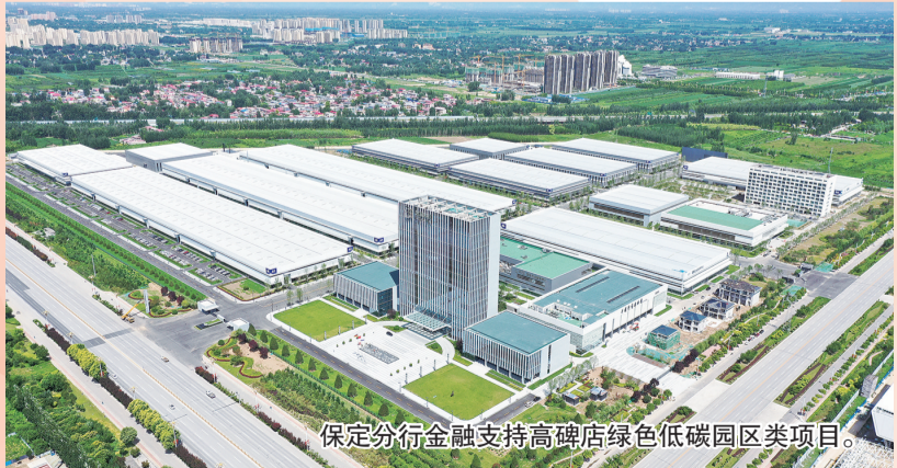
保定分行金融支持高碑店绿色低碳园区类项目。

工行保定分行践行绿色发展理念，助力“双碳”目标实现，绿色贷款余额182.86亿元。聚焦智能网联新能源汽车、超低能耗建筑、光伏风电等绿色产业，持续加大绿色信贷投放力度，推进绿色金融产品和服务创新，以金融力量推动保定绿色低碳转型。能源类项目审批金额合计87.98亿元，为绿色能源产业发展提供资金保障。服务重点绿色项目，累计为某超低能耗建筑项目投放贷款13亿元，助力其建成国内最大被动式建筑产业园；为某高新技术公司发放流动资金贷款1亿元，用于零碳产业园区日常经营，推动园区绿色低碳发展。积极探索绿色金融产品新模式，为售电企业参与光伏产业发展提供了创新金融支持，拓宽了绿色产业融资渠道。不断丰富绿色金融产品体系，满足不同绿色主体的融资需求，为保定建设天蓝、地绿、水清的低碳城市贡献工行力量。