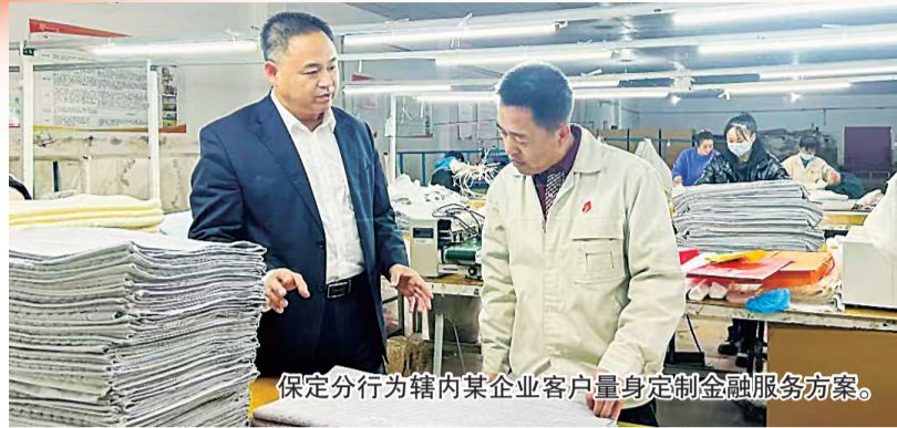
保定分行为辖内某企业客户量身定制金融服务方案。

守初心使命，谱华章。 2025年，工行保定分行全面践行金融工作的政治性和人民性，牢牢锚定“服务实体经济的主力军、维护金融稳定的压舱石、做强金融机构的领头雁、做专主责主业的标杆行”四大核心定位，将自身发展深度融入保定现代化品质生活之城建设大局，在国家战略落地、产业结构升级、民生福祉提升等关键领域持续发力，以精准高效的金融服务书写了国有大行服务地方经济社会高质量发展的新篇章。凭借稳健的经营态势与强劲的服务能力，为全市627.22万个人客户和8.92万对公客户提供了全周期、多元化的优质金融服务，成为推动保定经济社会发展的重要金融力量。