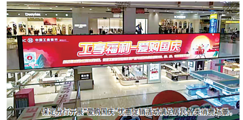
保定分行开展“爱购国庆”促销活动满足居民各类消费需求。

消费”联动平台，聚焦新能源汽车、家用电器、电子产品等大宗消费领域，量身定制消费补贴、分期免息、满减优惠等专属金融服务方案，降低市民消费门槛。2025年，累计开展各类主题促销活动百余场，深度参与地方政府消费券发放工作，通过线上线下多渠道做好宣传引导与受理服务，打通消费券使用“最后一公里”，助力消费券快速转化为实际消费需求，为消费市场注入强劲动力，拉动消费交易3.5万余笔，为消费者减免优惠金额151.8万元，切实让利于民，有效撬动大宗消费市场增长。协助文旅消费提质升级，精准把握文旅产业复苏机遇，与涿州市政府达成深度合作，全力支持智慧景区建设项目，为全市13家景区提供数字化改造资金与技术支持，推动景区实现票务管理、游客分流、数据互通等功能升级，构建“一站式”智慧文旅服务体系。提升景区运营效率与游客体验，带动周边餐饮、住宿、文创等关联产业发展，形成“金融赋能文旅、文旅拉动消费”的良性循环，为保定消费市场高质量发展注入新活力。