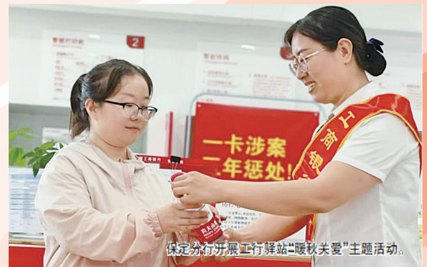
保定分行开展工行驿站“暖秋关爱”主题活动。

工行保定分行始终牢记国有大行的社会责任与使命担当，积极响应保定市委、市政府优化营商环境、提升城市温度的号召，将履行社会责任融入经营发展全过程。与市委社会工作部签署战略合作协议，揭牌启用保定首家“暖新驿站”，为辖内新兴领域（两企三新）从业者提供休息、饮水、充电、金融咨询等全方位、多层次的暖心服务，让城市服务更有温度。组织员工走进社区、走进乡村，开展免费社保卡换发服务到家活动，为老年群体、行动不便群众提供上门服务，切实解决群众办事难题。突出工行驿站“金融+泛金融”服务特色，全年开展线上线下“一体化”“送暖”系列公益宣传、工行驿站“感恩关爱”“驿启新生活”等主题活动240余场次，惠及广大市民群众，进一步提升了“工行驿站”的公益惠民服务口碑与社会形象。金融知识普及“贴近实际、贴近公众”，广泛开展反假人民币、防范非法集资、金融安全教育月等各类公益宣传活动220余次。在营业网点通过LED显示屏、液晶电视循环滚动播放宣教视频、标语132条；组织员工走进社区、街道、商超、学校，发放宣教折页2万余份，向市民普及金融知识，提升公众金融素养与风险防范能力。积极响应国家乡村振兴战略，通过消费帮扶、驻村帮扶等多种方式支持农村发展。全年积极购买贫困地区苹果等农产品，以消费帮扶助力农民增收；驻村工作队连续八年扎根乡村，深入了解村民需求，积极帮助有困难的村民解决上学、工作、看病等实际问题，全力防止返贫，用真心实意的帮扶赢得了村民的认可与好评。通过一系列社会责任的践行，工行保定分行切实担负起了金融机构的社会责任，展现了国有大行的责任与担当，为保定经济社会高质量发展贡献了温暖力量。