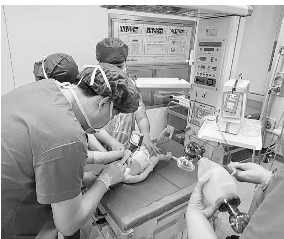
联合演练现场。

本报讯(新畿辅—保定日报通讯员葛川)保定市第二医院党委近日以“党建赋能”为核心启动“优质服务提升工程”,推动党建与业务深度融合,围绕技术提升、流程优化、模式创新、人文关怀等重点提质增效。其中,该院麻醉科、产科、儿科深化协作,构建起从分娩镇痛、紧急剖宫产到新生儿监护的无缝照护链,让母婴就医体验全面升级。