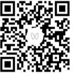
扫描二维码 观看视频

情，大人孩子争相举手，欢声笑语中将文明的理念悄然传递。日影渐斜，活动接近尾声。这份冬日温暖留在了空了的碗底，留在了新写的“福”字里，留在了孩子们举起的窗花上和人们的欢声笑语间，成为社区共同的腊八记忆。