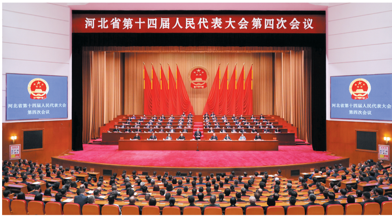
1月29日上午，河北省第十四届人民代表大会第四次会议圆满完成各项议程后，在河北会堂闭幕。

倪岳峰指出，刚刚过去的一年，是河北发展蒸蒸日上、“十四五”圆满收官的一年。全省上下深入贯彻党的二十大和二十届历次全会精神，认真贯彻落实四中全会部署，全面贯彻习近平总书记视察河北重要讲话精神，解放思想、奋发进取，