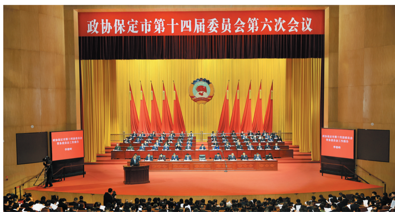
2月3日下午,政协保定市第十四届委员会第六次会议在关汉卿大剧院开幕。这是会议现场。