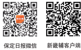
保定日报微信 新媒客户端