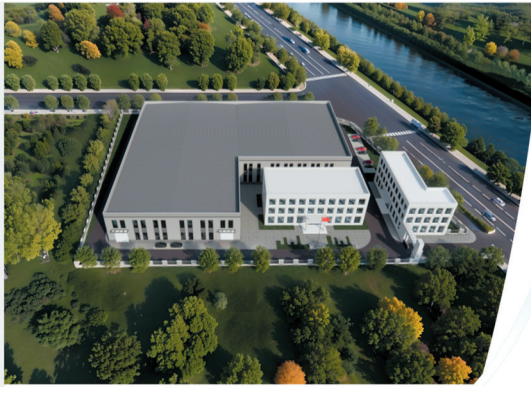
河北博晶年产2万吨午餐肉食品加工项目。