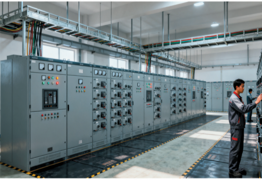
涿源河北智算中心项目。