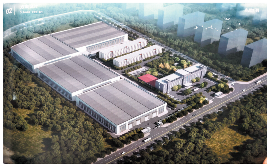
涿源中桥重钢年产5.3万吨钢结构生产线项目。

京西夏都，兴业热土。回首2025，深耕不辍，基础筑牢；展望2026，蓝图已绘，新程已启。这里，正以山的坚韧夯实基础，以水的开放汇聚资源，向所有城市合伙人发出春天的邀请，携手共创一幅属于新时代的高质量发展壮美画卷。