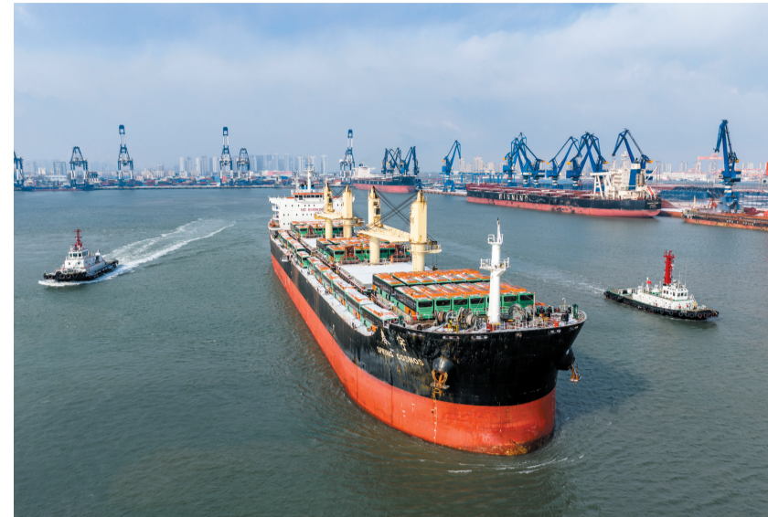
山东烟台：天然气公交车出口墨西哥

(GDP)的比率降至13.9%，首次降低至14%以下，较“十三五”末下降0.8个百分点，再创有统计以来的最好水平。