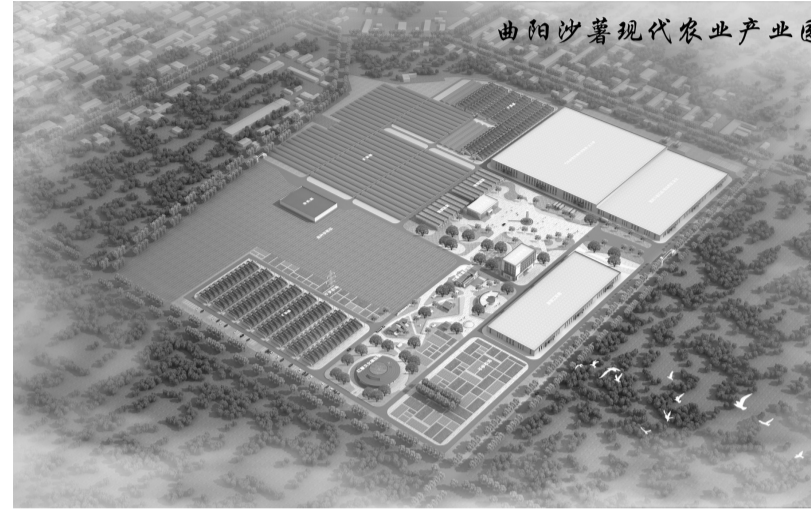
曲阳沙薯现代农业产业园规划示意图。

1月28日,“薯千岁”沙薯首次亮相头部主播李佳琦直播间,上线仅2分钟即售出超4000单,好评率高达98%;2月5日,该产品再度登陆“李佳琦零食节·年夜饭专场”,3分钟销量突破6000单。凭借稳定的品质与完善的售后保障,“薯千岁”迅速成为直播平台农产品爆款,标志着曲阳沙薯成功打开全国市场。