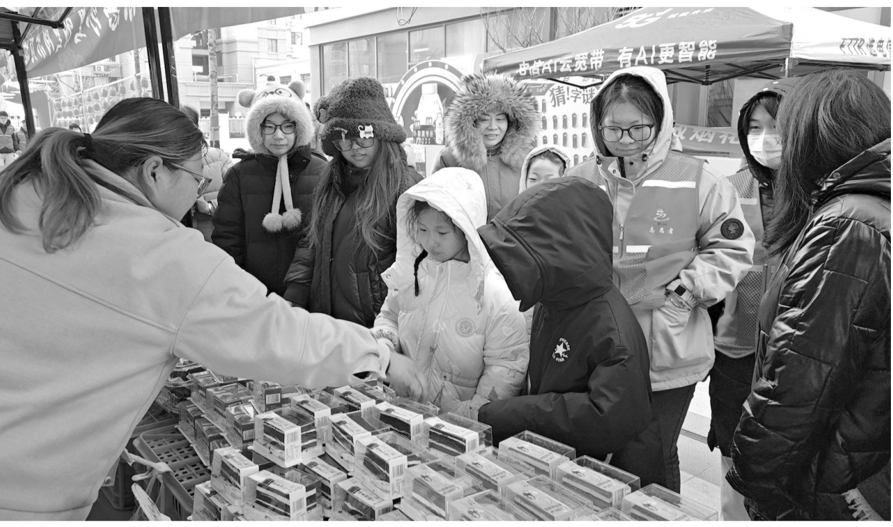
万和春天社区年货大集人气旺。