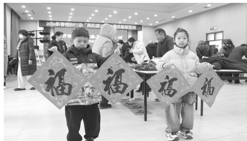
活动现场，小朋友展示福字。