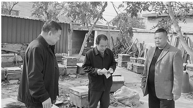
党委关于继续大力实施消费帮扶的决策部署,为脱贫户农产品拓宽销售渠道、搭建销售桥梁,为带动脱贫