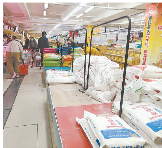
乐淘生活广场部分面粉区域已出现空货。

随后,就此问题记者联系了保定新发地联农市场。相关负责人称,现在整个市场货源充足,蔬菜存储量4000吨,米面油储量1500余吨,可以保证市民正常生活需求。