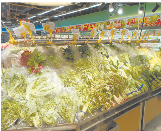
东风路一家超市蔬菜柜台,新鲜蔬菜供应充足,价格有所下降。

记者咨询市发改委价格监测调控处得知,根据监测数据,10月初,该处所监测的17种蔬菜平均价格为3.07元/斤,国庆节后蔬菜价格开始出现较大幅度上涨,在10月底达到高峰,平均价格为4.64元/斤,11月初开始出现下降趋势。