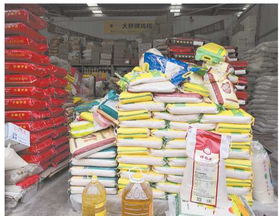
保定新发地联农市场洋粮粮油商贾备满了米面油。