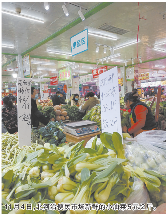
11月4日,北河沿便民市场新鲜的小油菜5元/2斤。