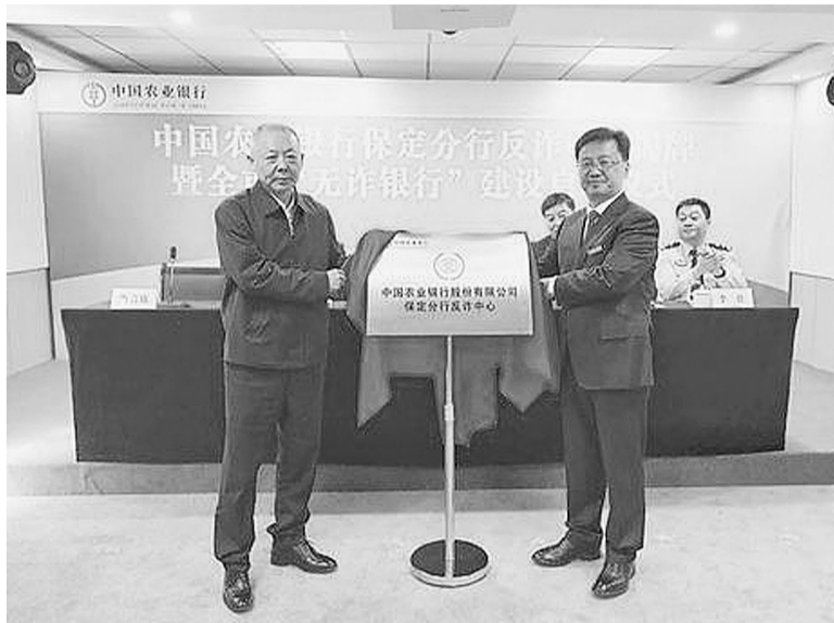
农行保定分行举办反诈中心揭牌暨全市“无诈银行”建设启动仪式。

以“农行员工及家属零发案、服务对象全覆盖”为目标,建立常态化宣传机制。该行邀请民警开设反诈专题讲座,培养反诈骨干力量;组织员工、员工家属及客户下载安装国家反诈中心APP,共同学习《防范电信网络诈骗宣传手册》;开展反诈宣传进社区、进农村、进企业等活动,并将每一个营业网点作为向群众普及反诈知识的前沿阵地,向客户发放《防范电信网络诈骗明白纸》,严格执行“双录”等制度,提升宣传、预警、劝阻水平。