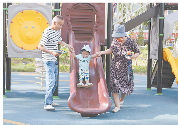
在很多口袋公园,滑梯等备受孩子们喜欢。