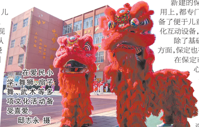
在爱民小学,舞狮、扇子舞、武术等多项文化活动备受喜爱。

手牵手同撑关爱伞,心连心一起向未来。保定,儿童友好城市的金名片,正在上下一心中被擦亮,愈发熠熠生辉。