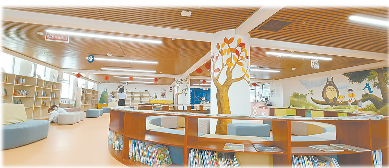
保定市少年儿童图书馆河北省面积最大。

率先发布建设儿童友好城市“动员令”,率先完成顶层设计政策支撑,率先出台方案推动先行落地,率先建立高规格联动机制凝聚合力,率先融合冠军元素凸显文化特色,率先激发市场活力形成多元参与。