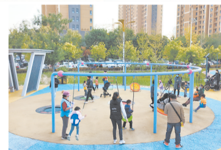
银杏公园里孩子们玩得不亦乐乎。