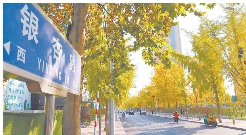
银杏树妆点整条街道。