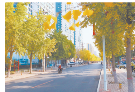
银杏树叶黄绿相间成一路风景。