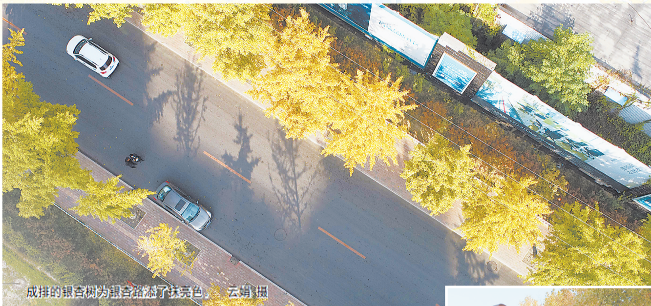
成排的银杏树为银杏路添了抹亮色。

特别是,不只有银杏的金黄美景可以打卡,来到银杏路,周边文艺气息浓郁的好吃好玩的地方也值得流连。