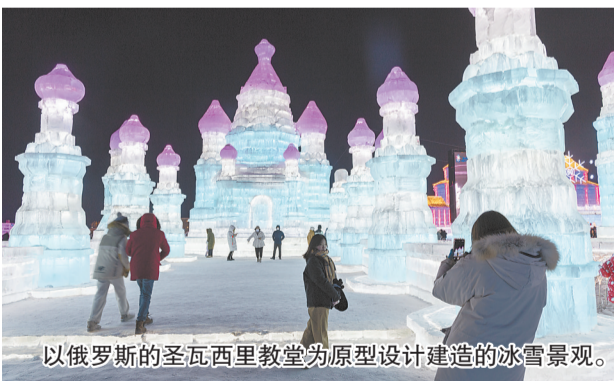
以俄罗斯的圣瓦西里教堂为原型设计建造的冰雪景观。