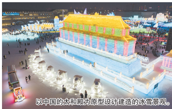
以中国的太和殿为原型设计建造的冰雪景观。