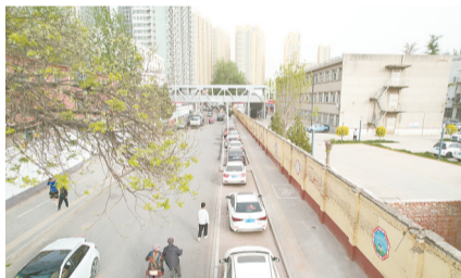
德惠东路头顶上各种杂乱无章的飞线不见了,天际线清晰又明朗,视野更开阔。

经过20多天的治理,德惠东路治理飞线7000余延米,拆除线杆20余个,私拉乱扯的现象不复存在。“整改之后,对我们住户来说环境好了、更安