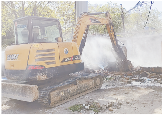
随着环城水系二期项目的进行,又一处千余平米的违建被成功拆除。