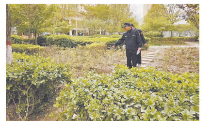
执法人员综合整治小区内及周边环境卫生、绿化、路灯照明、私搭乱建等。