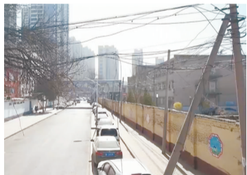
德惠东路飞线杂乱无序“满天飞”现象严重。

近期,竞秀区执法局积极协调各相关部门单位,制定专项整治方案,对辖区道路两侧上空中搭挂的飞线进行规范治理。尤其是在德惠东路,竞秀区执法局、东风执法队组织多家通讯公司,对飞线问题召开多次现场工作会,相关