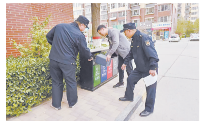
在联合多个部门对小区综合整治期间,执法人员也对文明养犬、垃圾分类等进行宣传和引导。

除了对小区环境进行整治外,直属三大队还积极推动小区适老化改造和无障碍设施建设,合理布局和建设增加公共活动场所小型运动场地和健身设施,提升小区居民宜居和生活质量。积极会同相关部门推进居民小区市政基础设施智能化改造、智慧安防建设,搭建社区公共服务综合信息平台,整合社区安保、车辆、公共设施管理、消防设施运行、生活垃圾分类等数据信息,规划停车位、门禁管理、消防物联网监控等领域智能化,打通服务群众的最后一公里,进一步推进居民小区共享设施建设,有效提升居民群众的幸福感、获得感。