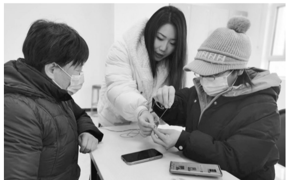
居民在老师的指导下学习编织手艺。

保定晚报讯(通讯员韩子娟)1月11日,竞秀区假日丽城社区开展了“巧手编织 幸福生活”手工编织活动,邀请专业手工老师面对面指导大家学习编织技艺。