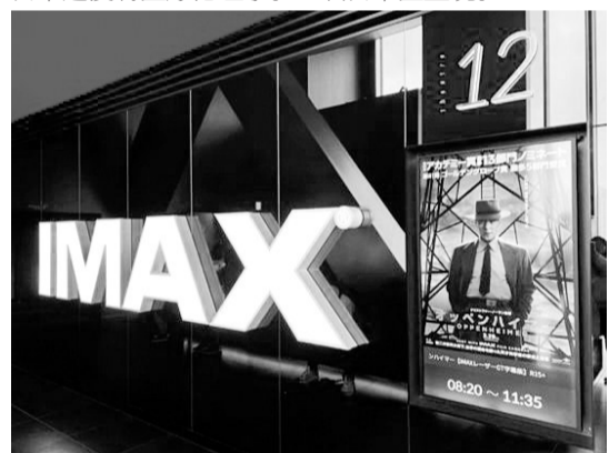
3月29日,电影《奥本海默》在日本上映。

有日本网友表示,“731部队”一直被视为“禁忌”,相关纪录片的采访也很难。“日本就连医学院的医疗伦理教科书上也没有出现‘731部队’。从这个意义上说,日本还没有医疗伦理学。”一名日本医生说。