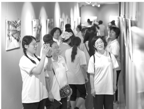
群众在西高庄村村民原创书画前驻足、欣赏。

保定晚报讯(通讯员刘宗泽 刘思源 李沐星)6月12日,“强基工程——与党同心 与民同行”莲池区西高庄新时代文明实践文艺志愿服务成果暨西高庄巨变群众文艺作品晋省展览开展,在河北省文艺家之家开展。