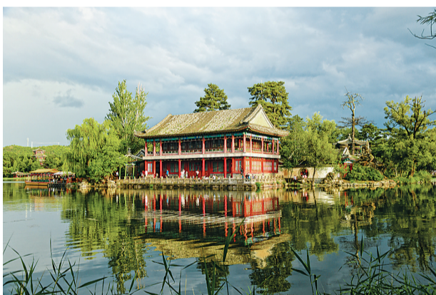
避暑山庄烟雨楼。避暑山庄,又称“承德离宫”或“热河行宫”,是一座集历史、文化、自然与建筑艺术于一体的皇家园林。

九龙醉文化产业园中,流传300年的古窖依然散发着生命力。承德九龙醉酒文化产业园是以展现满族文化为底蕴、酒文化为特色,集商业、特色旅游、酒文化产业、创意文化生活为一体的综合性健康文化产业园。2018年被评为国家级AAA级景区,河北省工业化旅游示范单位,已成为丰宁一张“靓丽的文化名片”。