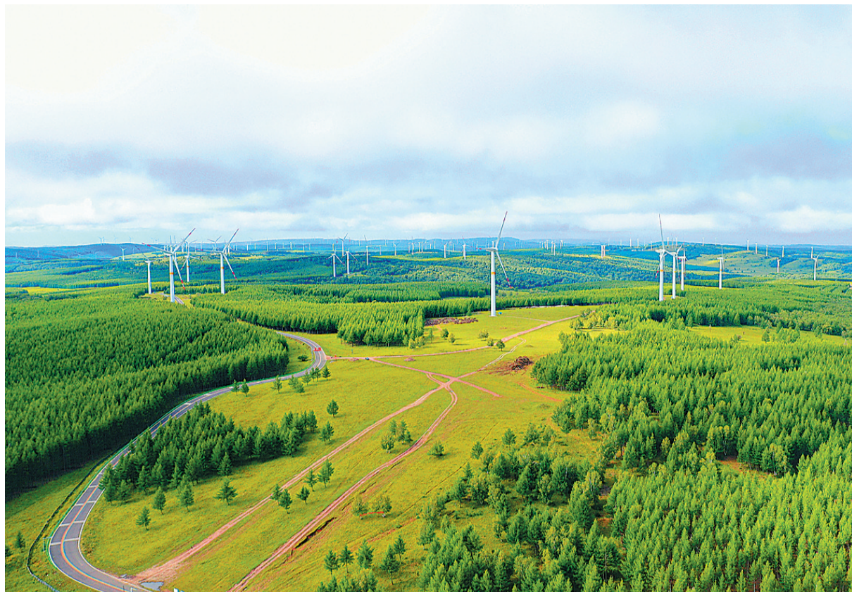
承德坝上草原风光。承德市是塞罕坝精神发源地,也是京津冀水源涵养功能区、京津冀西北部生态环境支撑区、国家可持续发展创新示范区。