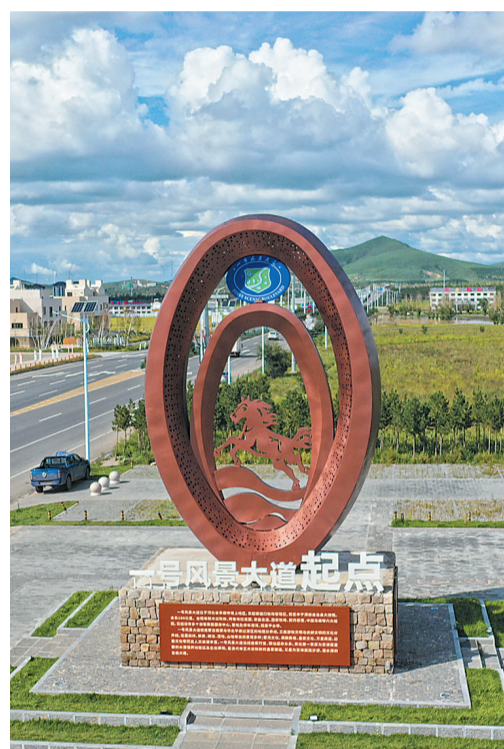
国家一号风景大道的休闲区。