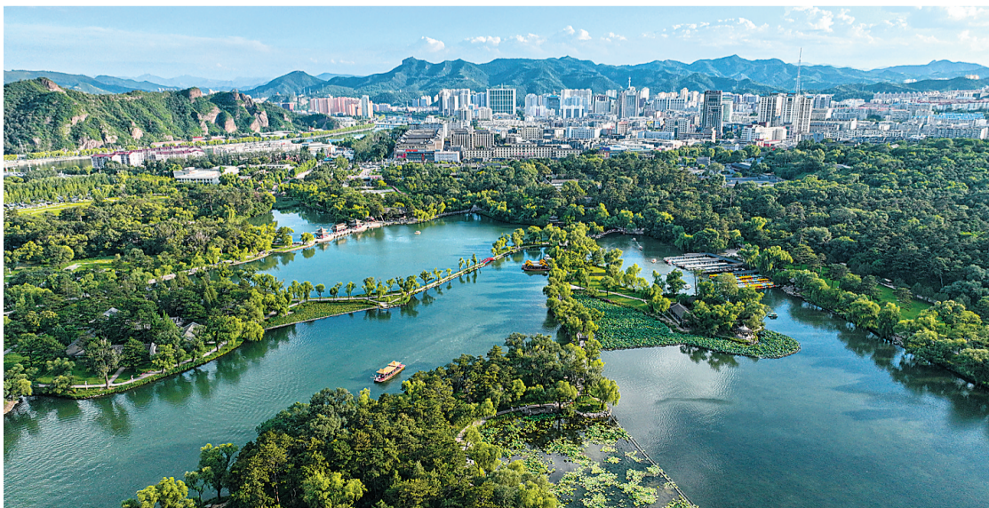
鸟瞰避暑山庄。避暑山庄的建筑布局精妙绝伦,按使用功能可划分为宫殿区和苑景区两大部分,2007年被评为国家5A级旅游景区。

国家一号风景大道起点。“国家一号风景大道”是蒙古高原与华北平原过渡区的地理分界线,这里集聚了森林、草原、湖泊、湿地、山地等多种自然景观,一路走来,天蓝、山绿、水清,美不胜收。