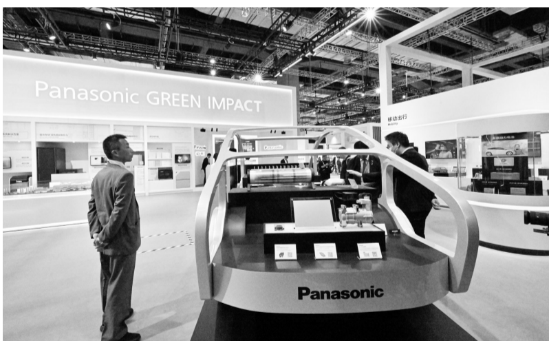
11月5日，参会者在第七届进博会消费品展区松下展台参观。