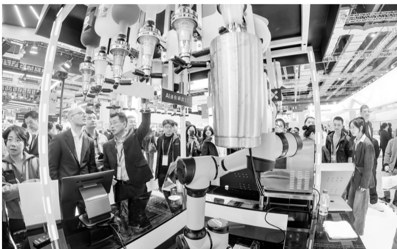
这是11月6日在第七届进博会技术装备展区西门子展台拍摄的AI迷你调酒工厂。