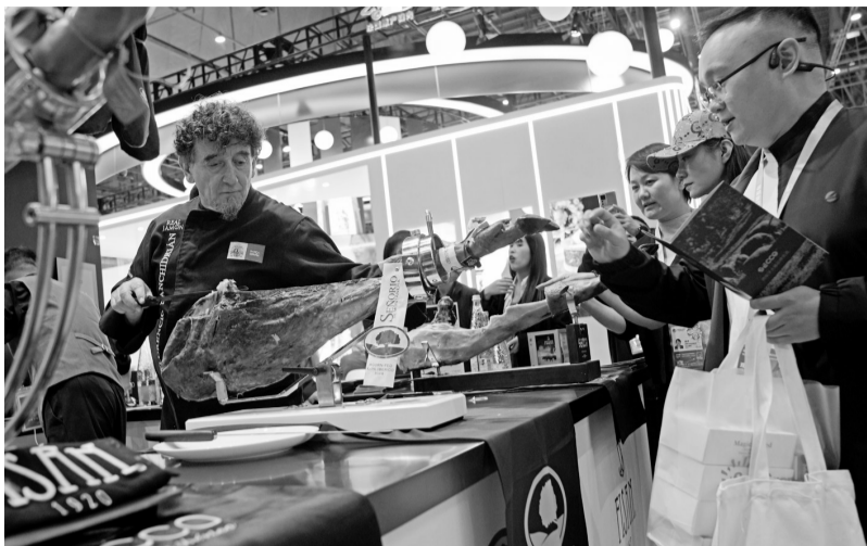
11月6日，在第七届进博会食品及农产品展区，观众在品尝西班牙火腿。

据介绍，前六届进博会累计意向成交额超过4200亿美元。第七届进博会交易团数量又创下历届之最，39个政府交易团和4个行业交易团，共计780个分团到会采购，瞄准全球优质产品和服务，实现