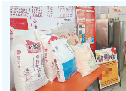
爱心企业为依棉社区老年食堂捐赠了白面、食用油、大豆、玉米面等一系列农产品。