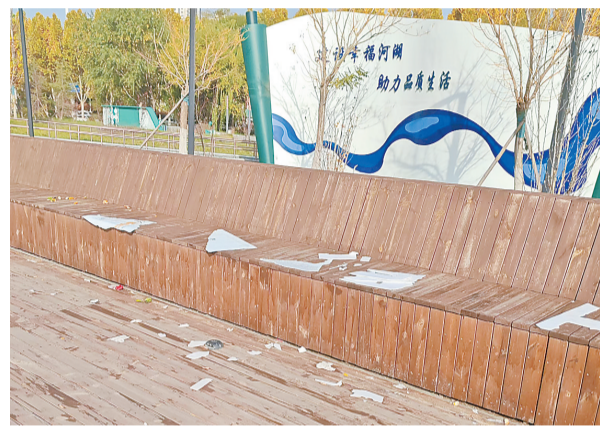
在北二环与阳光北大街交界附近的北湖公园观景台上,有许多游人遗留的垃圾,十分影响城市形象。