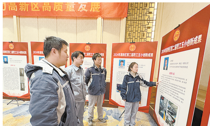
获奖职工现场讲解个人创新成果内容。

搭建了一个展示才华、交流经验、切磋技艺的平台,希望通过示范带动和典型推介,促进职工互学互鉴、互帮互助,加快形成可复制、可推广的实践经验,营造尊重劳动、崇尚技能、鼓励创新的良好氛围。