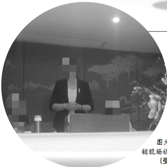
因为当事人提供的推销现场视频截图。

记者采访发现，盯上老年群体的“保健品”骗局已成顽瘴痼疾。相较于过去线下会销场所多选择酒店会议