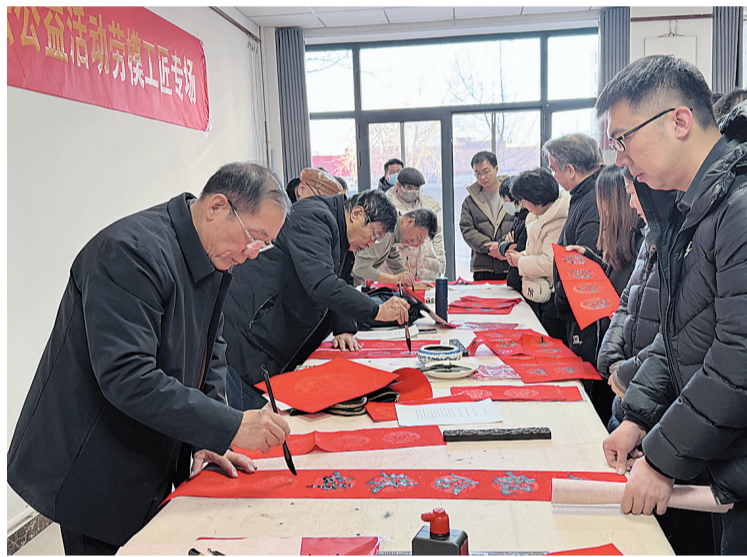
书法家挥毫泼墨书写春联、福字。

活动现场翰墨飘香、人头攒动,书法家挽袖执笔、挥毫泼墨,撰写关于歌颂劳模精神、劳动精神和工匠精神的春联,把对生活的热爱、对劳模工匠的诚挚祝福融入笔端,书写出一副副饱含深情的春联和福字,传递着浓浓年味和暖暖工会情。劳模工匠们围聚在书法家周围,近距离感受中华优秀传统文化魅力,领取这份满含墨香的新春祝福,现场洋溢着欢乐祥和的节日氛围。