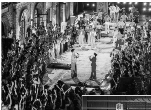
◀中国·保定乡村音乐大会现场。(资料片)

据悉,中央广播电视总台“《金牌新字号》2024年度盛典”将于1月21日晚22:15在央视财经频道(CCTV-2)播出。