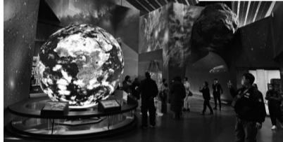
◀“保你好看,一定精彩”系列主题活动中,网络达人们在工作人员带领下参观中国古动物馆(保定自然博物馆)。