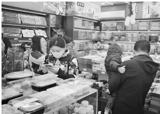
市民游客在天津古文化街桂发祥和果仁张“联合店铺”选购产品。

申遗成功后的第一个春节即将来临，记者近日在浙江、广西、天津等地走访发现，今年春节年货市场热点纷呈：非遗元素进一步凸显，数字服务拓展消费场景，全球商品为消费者提供更多选择……琳琅满目的年货，烘托出渐浓的节日氛围，也映射出消费的巨大潜力。