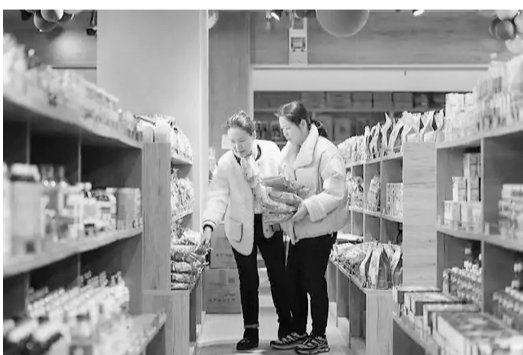
1月13日，顾客在义乌国际商贸城五区的一家进口食品商店内挑选商品。