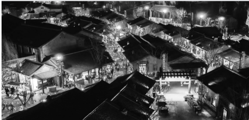
▲太行水镇非遗灯会。