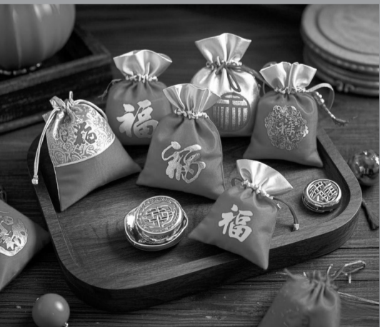
本版图片均由 AI 生成