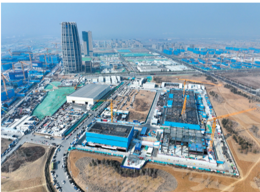
这是由中建三局承建的中国矿产资源集团有限公司雄安总部项目建设现场(2月27日摄,无人机照片)。