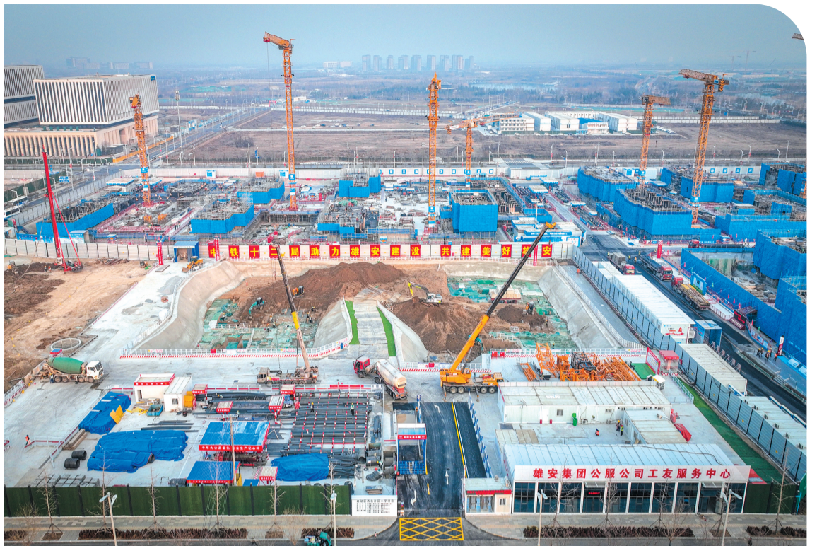
这是由中铁十二局承建的雄安新区启动区西北片区小学项目建设现场(2月27日摄,无人机照片)。