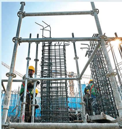
2月27日,中国五冶集团工人在雄安新区起步区第五组团大学城配套一期项目三标段建设现场施工。