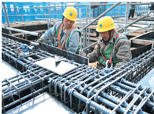
2月27日,中建三局工人在中国矿产资源集团有限公司雄安总部项目建设现场施工。