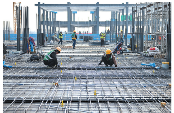
2月27日,中建三局工人在中国矿产资源集团有限公司雄安总部项目建设现场施工。