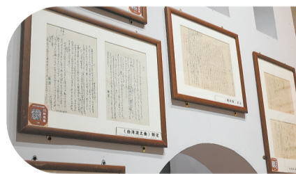
孙犁先生的珍贵手稿。

人性美,让人爱不释手,让读者在不断阅读中享受畅快的艺术之美,从中感受信心和力量、理想和希望。认真想来,与其说我是协助孙犁同志做一些工作,不如说是在他的指导下从事编辑、理论学习和文学创作。”冉淮舟说:“这是我一生的幸运,也是我一生的财富。”