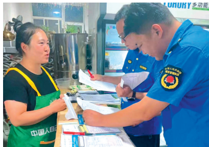
涿水县执法局为考生筑牢考试保障防线。

保定新奥燃气启动学校及周边餐饮业燃气安全专项检查,以拉网式排查划分区域,对保定一中考点等学校及周边用气单位检测管道、灶具等关键部位,登记隐患并督促整改,同步普及安全知识与应急处置方法。目前,已完成