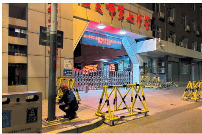
城市照明管护服务中心组织专业维修人员对各考点周边的功能照明路灯、夜景亮化景观灯开展拉网式排查。