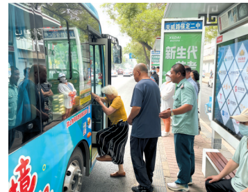
公交公司安排40余名工作人员在天水桥码头周边站点,以及三大公交枢纽站,引导乘客有序乘车。

安全运营 7600 余趟,运送乘客 37.3 万人次 端午假期 保定公交全力打造 优质公交出行环境