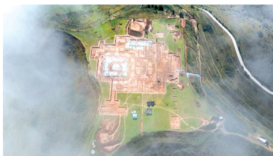
这是甘肃省陇南市礼县四角坪遗址考古发掘现场。

“虽然形制尚不如后世成熟,但已初具雏形。”侯红伟说,这一发现对研究中国古代阙门起源与演变具有重要意义。