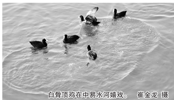
白骨顶鸡在中易水河嬉游。

丰茂生长,鱼类资源日渐充沛。如今,野鸭和白鹭、池鹭等鸟类,频频现身治理后的河道,在水草间觅食、栖息,成为易水河畔生态之变的新图景。