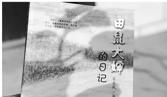
《田鼠大婶的日记》,书里有20万字和44幅插图。

“我不愿意像一个老母鸡一样,我就应该像一只鹰,飞得更高更远。”她最高兴的时候,就是去地里干活,因为“田野上只有我和我的庄稼,世界特别广阔,但是又只属于我一个人,我可以尽情看书写字”。