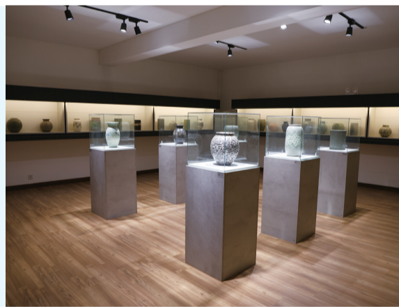
易县绞胎瓷博物馆展品。